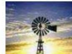
Proizvajalci, dobavitelji in distributerji energije